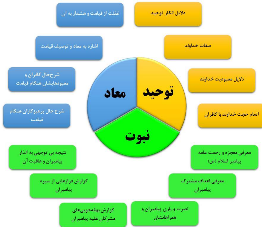
شکل (۲): شبکه مضامین مرتبط و به هم پیوسته سوره انبیاء

این پژوهش با حمایت مالی دانشگاه تربیت دبیر شهید رجایی طبق ابلاغ شماره ۴۹۲۹ انجام شده است.