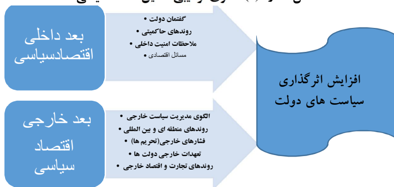
شکل شماره (۱): الگوی ترکیبی تحلیل اقتصاد سیاسی

الف. عوامل داخلی: فرهنگ سیاسی، نظام سیاسی، جمعیت، گسست‌های اجتماعی. ب. عوامل خارجی: روندهای منطقه‌ای، الگوهای رقابت-همکاری، اتحاد-دشمنی. در پژوهش حاضر الگویی ترکیبی مدنظر است؛ چراکه با تعریف ترکیبی مقاومت تناسب بیشتری دارد و توان بهتری برای تحلیل راهبرد مقاومت به ما می‌دهد. در این الگو، اقتصاد سیاسی در دو سطح داخلی و خارجی و با نه مؤلفه اساسی به شرح زیر تبیین و تحلیل می‌شود (نک: شکل شماره ۱).