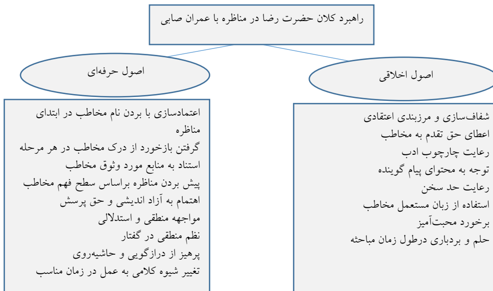
شکل شماره ۳: راهبرد حضرت رضا (علیه‌السلام) در مناظره با عمران صابی