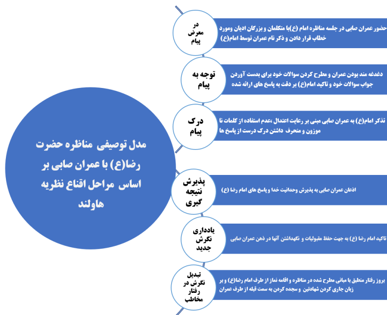
شکل شماره ۲- مدل توصیفی مناظره حضرت رضا (علیه‌السلام) و مراحل اقتناع هاولند

نخستین متغیر متقاعدسازی منبع است و ویژگی‌هایی برای اثربخشی بیشتر پیرامون آن مطرح شده است. منبع باید دارای جذابیت، تخصص، مقبولیت، اعتبار و خوش خلقی باشد. حضرت رضا (علیه‌السلام) در ابتدای ورود به بحث حضرت (علیه‌السلام) با دعوت عمران به انصاف و دوری از سخن باطل و فاسد و منحرف از حق با او وارد گفت‌وگو می‌شود و تمام تلاش حضرت نمایش تمام‌عیار ادب، روی خوش و استقبال از یک انسان صاحب‌فکر، به‌دوراز مرزبندی‌های اعتقادی است. به عبارتی حضرت مطالب خود را در بستر استدلال‌ها، مثال‌ها و استنتاج‌هایی پیش می‌برند که پایه عقلانی داشته و به این صورت اعتبار بیانات خویش را مستند می‌کنند. مطرح کردن موضوعات اصلی پیرامون وحدانیت خدا جذابیت را در کلام امام رضا (علیه‌السلام) به‌قدری بالا می‌برد که مخاطب به‌طور کامل تحت تأثیر قرار گرفته و از حضرت رضا (علیه‌السلام) می‌خواهد که به شکل مبسوط‌تری نقطه نظرات خود را ادامه دهند. ایجاد جذابیت در