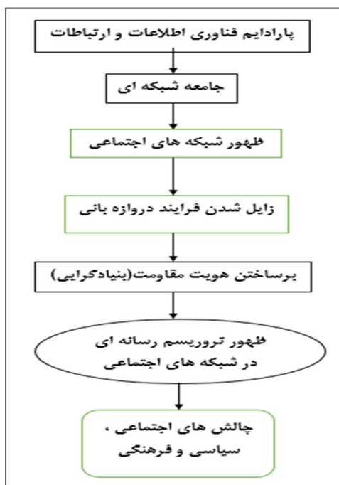
نمودار ۱- چارچوب مفهومی مقاله (طراحی از نگارندگان مقاله، ۱۳۹۵).

«تروریسم رسانه‌ای اجتماعی استفاده از رسانه‌های شبکه‌ای و اجتماعی برای افزایش تأثیر اقدامات خشونت‌آمیز بکارگرفته شده به دلایل اجتماعی، سیاسی و یا مذهبی و با هدف گسترش درد و رنج روانی، عاطفی و جسمی بر مخاطبان بلاواسطه است. (Smith and others, 2015, p.10). به گفته بریجیت ناکوس (Brigitte Nacos, 1994) «تروریست‌ها با اعمال خشونت در پی تحقق سه هدف اصلی توجه، برساختن و مشروعیت هستند» (Epkins, 2011, p.31). دال مرکزی گروه‌های تروریستی در شبکه‌های اجتماعی خشونت سیاسی است: «خشونت سیاسی شکلی از ارتباطات است که از طریق نمایش انگاره‌های مرگ و به منظور ایجاد وحشت و ارباب، بر اذهان مردم تأثیر می‌گذارد» (کاستلز، ۱۳۹۳، ترجمه بصیربان، ۷۴۴). کنشگری گروه تروریستی داعش در شبکه‌های اجتماعی تویتر و فیس‌بوک، نوع متأخر تروریسم رسانه‌ای را برجسته می‌سازد. این‌گونه جدید را نگارندگان این مقاله برای متمایز ساختن از سایر