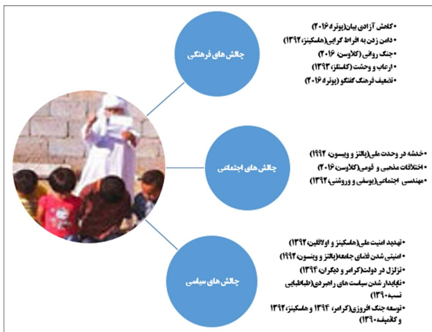
نمودار ۲ - چالش‌های ناشی از تروریسم رسانه‌ای در شبکه‌های اجتماعی (طراحی از نگارندگان مقاله)